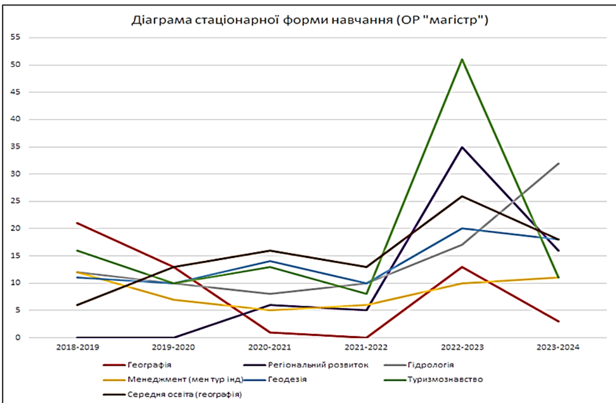
Рис. 2. Динаміка контингенту магістрів по ОП (2018-2023)